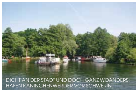
DICT AN DER STADT UND DOCH GANZ WOANDERS: HAFEN KANINCHENWERDER VOR SCHWERIN.

Lübstorf: (0 38 42 3) 5 49 00. Schloss Wiligrad mit Skulpturenpark und Ausstellungen (0 38 67) 88 01.